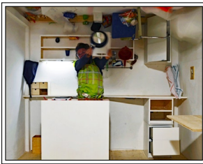
Thomas Sterna

Studierte von 1993 - 1999 am Städel in Frankfurt Film bei Peter Kubelka. Die beiden Filme „BLAUFILM / LAMPENSCHWARZ“ entstanden „aus einer durchgehenden Finger- und Handarbeit (ohne Kamera und ohne Schnitt) mit den Materialien „Blankfilm, blaues Pigment (prussian-paris blue) / schwarzes Pigment (lampenschwarz) und durchsichtiges Silikon. In diesen Filmen sieht man fast 14.000 / 17.000 verschiedene Blaubilder / Schwarzweissbilder, die mit einer Geschwindigkeit von 24 Bilder pro Sekunde laufen und verschiedene blaue / schwarzweisse Bewegungen erzeugen.“ Goh Harada