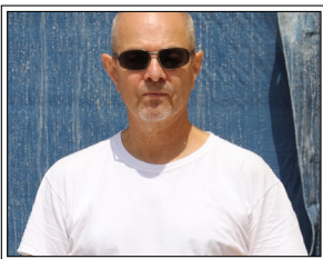
Dan Senn

Er studierte Germanistik und Philosophie und Freie Kunst in Mainz. „Im Zentrum der Arbeit Rolling Home stand ein zweistöckiges Holzhaus von 4 Metern Breite, eingefasst in Holzräder von 6,5 Metern Durchmesser. Im Untergeschoß dieses Gebäudes, das sich durch eine komplexe mechanische Lagerung der Räder vollständig um seine eigene Achse drehen ließ, befand sich eine vollständig eingerichtete kleine Küche. Der Künstler versuchte darin, gemäß den Vorgaben verschiedener Kochshows (zu sehen auf einem fest installierten kleinen Monitor) zu kochen.“ Thomas Sterna