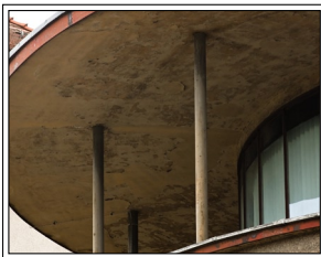
Aufnahme 2009 • Foto, P.Wießenthaner

Dan's work moves freely between expressive extremes and languages depending upon the aesthetic joust at hand.“ Dan Senn